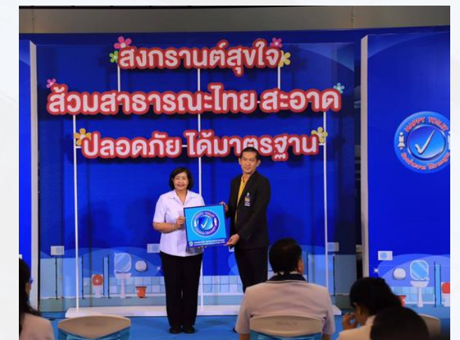
มาตรฐานอนามัย สิ่งแวดล้อม