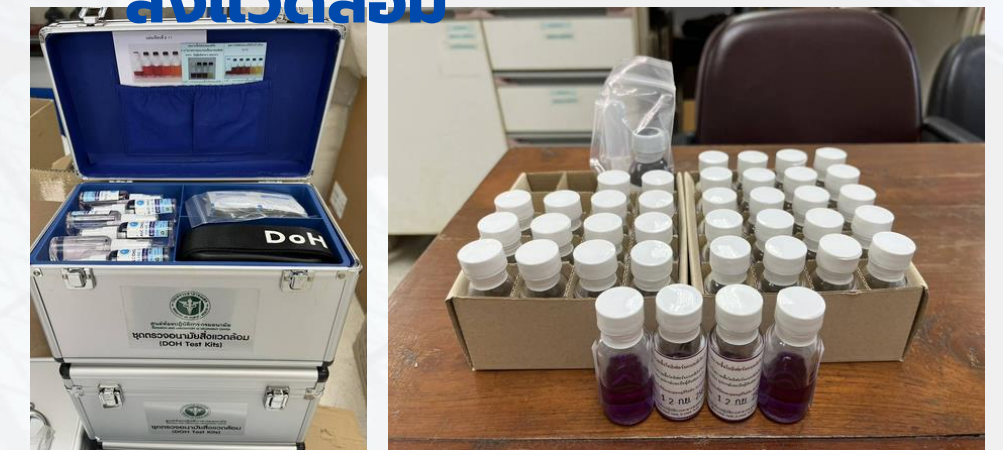
Environmental health Laboratory