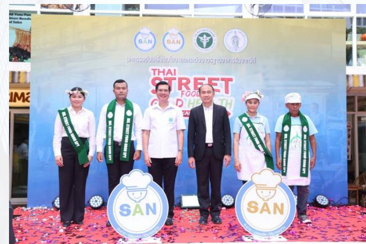
Street Food Good Health