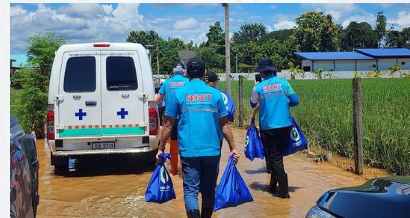
SEhRT กรมอนามัย