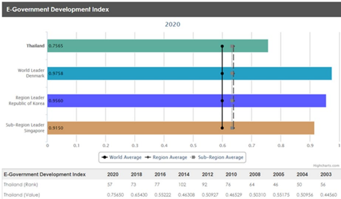
ภาพที่ 4 อันดับดัชนีรัฐบาลอิเล็กทรอนิกส์ของประเทศไทย