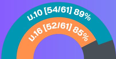
องค์การมหาชน