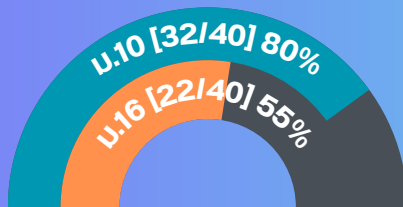
รัฐวิสาหกิจ