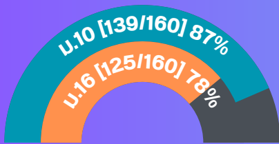
ราชการส่วนกลาง

ข้อมูลหน่วยงานของรัฐที่ดำเนินการเรียบร้อยแล้ว