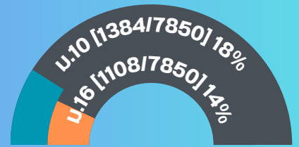
องค์กรปกครองส่วนท้องถิ่น